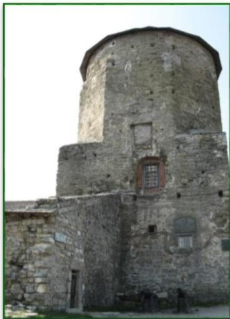
Башта Кармалюка, або Папська башта (Кам'янець-Подільська фортеця)

Повернувшись на Поділля, Кармалюк знов продовжував боротьбу. Протягом чотирьох років його загони влаштовували поміщикам на Поділлі справжні тортури, аж доки у 1822 році його знову не схопили під час облоги. Скориставшись знанням російської мови, під час слідства він видав себе солдатом із Костроми. Коли його запроторили в Кам'янець-Подільську фортецю, він знову спробував утекти, але був поранений, потім схоплений.