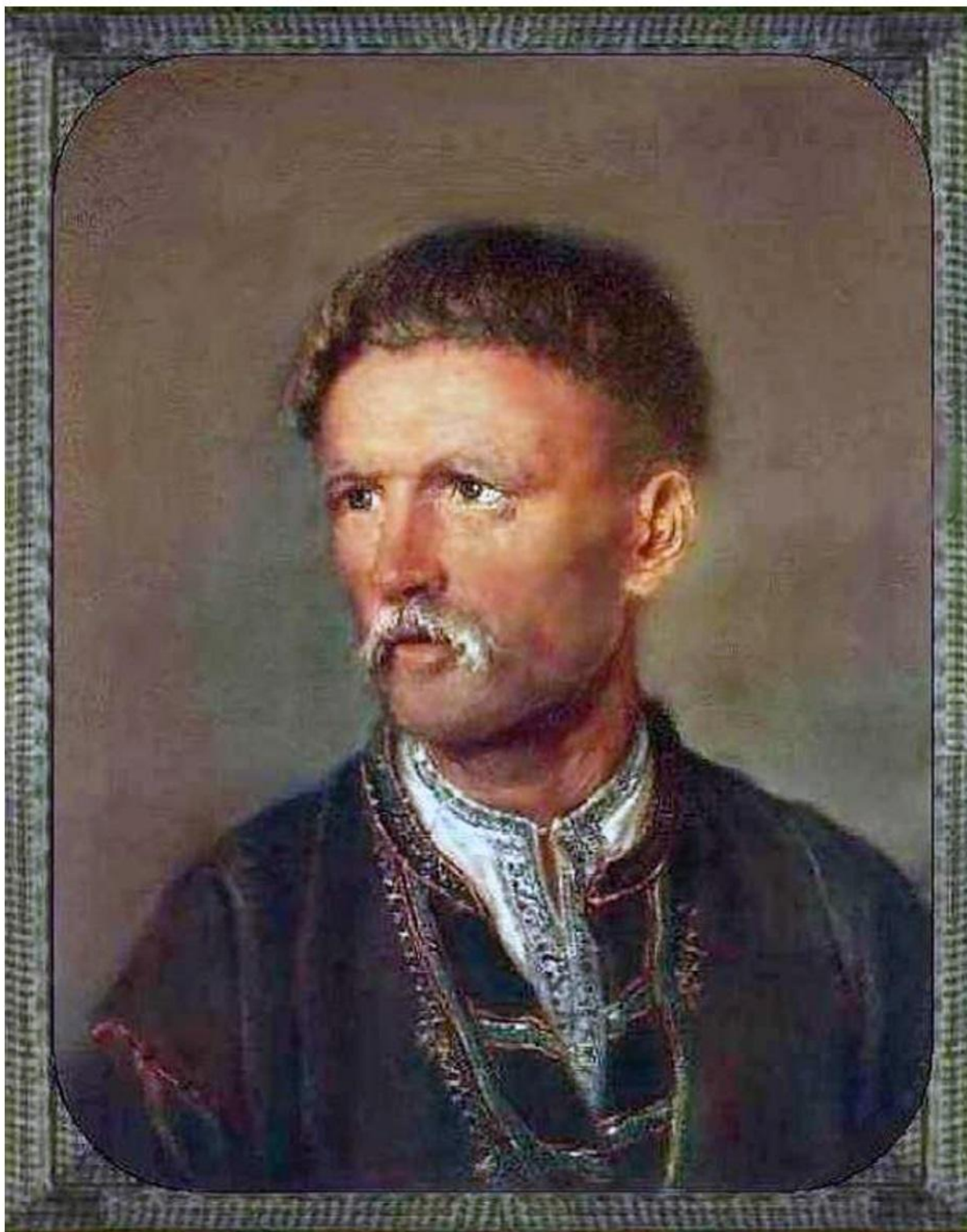
Устим Кармалюк (1787-1835 рр.)